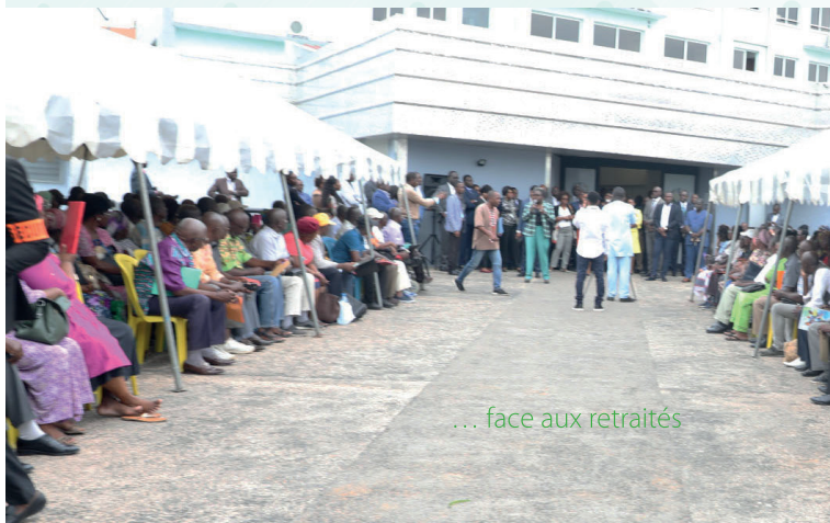
... face aux retraités