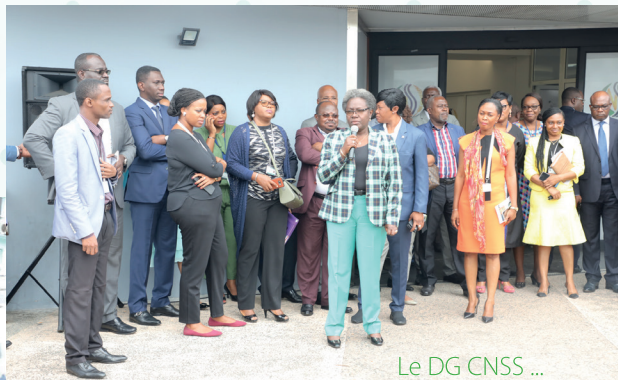
Le DG CNSS ...

Le Directeur Général de la Caisse Nationale de Sécurité Sociale (CNSS), récemment échangé, dans le cadre de l'Immeuble dit « la Méridienne » au quartier Glass, avec les retraités dont les dossiers sont en souffrance dans les circuits de traitement de l'Institution depuis plusieurs années.