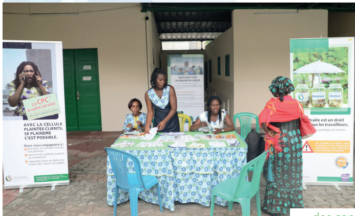
... des consultations