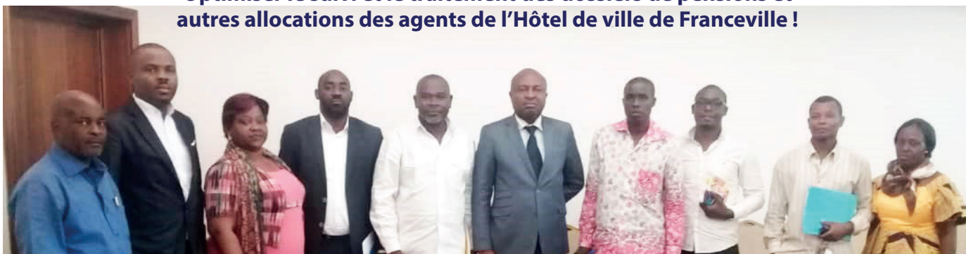
Responsables CNSS DROLHA et autorités municipales locales