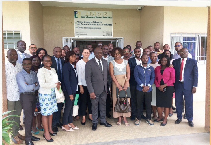
Délégation CNSS et Responsables CNPSS

En marge de cette mission sur le RTMI, la délégation gabonaise a mis à profit ce séjour ivoirien pour s'imprégner du modèle achevé et réussi de la déconcentration effective des activités métiers de la CNPS (prestations techniques, recouvrement