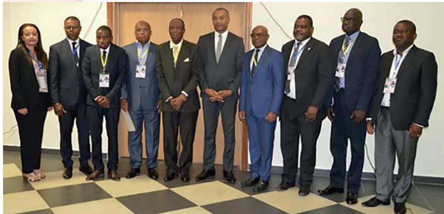
Le comité scientifique des travaux

La Caisse Nationale de Sécurité Sociale, à travers la Direction de la Prévention des Risques Professionnels et le Département Médecin Conseil, a pris une part active à la Première Journée Nationale Scientifique de la Société Gabonaise de Santé au Travail, célébrée sous le thème «Maladie chronique non transmissible et aptitude au travail». Un thème qui fait du Médecin du travail l'élément essentiel de la prévention des risques professionnels, étant entendu que selon l'Organisation Mondiale du Travail, les maladies professionnelles deviennent progressivement l'une des principales causes de mortalité.