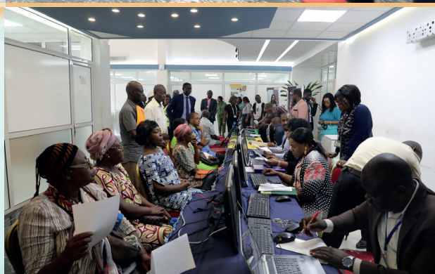
Le Guichet des plaintes et recours

Pour y remédier, le Directeur Général a instruit ses collaborateurs à mettre tout en œuvre pour un traitement diligent de tous les dossiers non aboutis dans le cadre d'un Guichet unique. Aussi, toutes les équipes sont-elles mobilisées aussi bien à la Direction des Prestations Techniques (DPT), qu'à la Direction de l'Immatriculation et du Recouvrement (DIR) pour examiner méticuleusement les dossiers en cours de traitement.