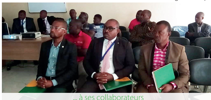
... à ses collaborateurs

Ils se sont à cet effet, appuyés sur les dispositions pertinentes du Code du travail en la matière.