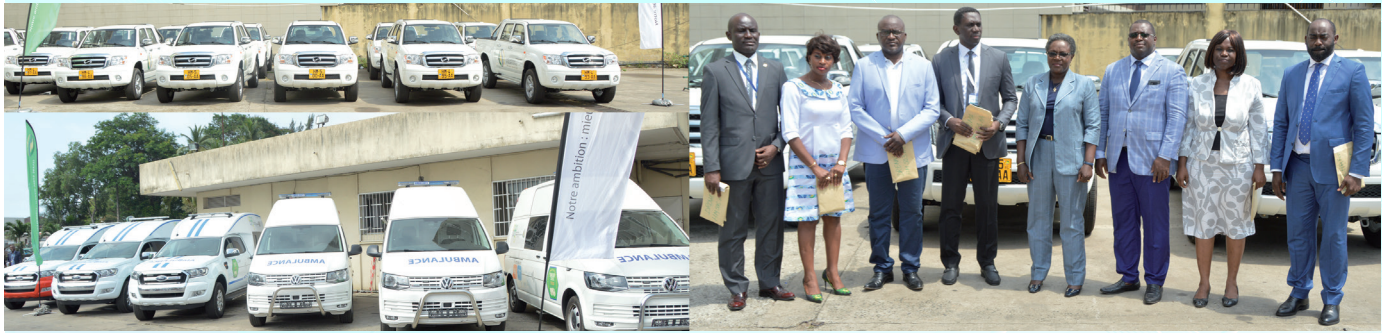
Cérémonie de dotation de moyens roulants aux Directions Régionales et Agences rattachées

« J'invite pour ainsi dire les uns et les autres au civisme et au sens de responsabilités pour éviter de tomber dans les travers d'hier ».