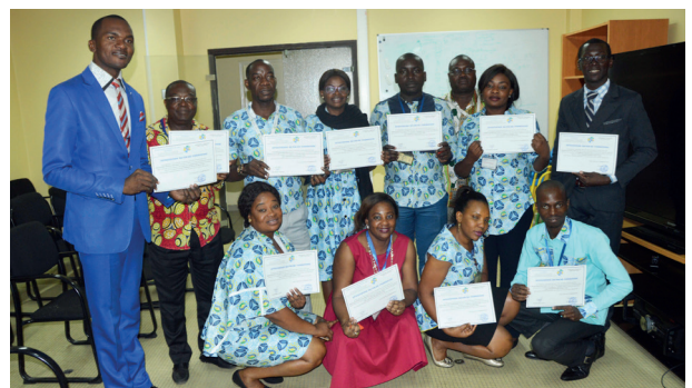
Remise des Attestations aux agents formés sur les pratiques des codes du langage des signe