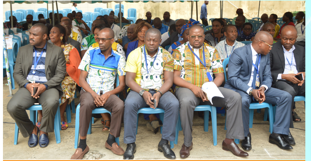
Une vue des CNSSistes

tionnelles, les procédures d'accès au Car Plan, la remise à plat de tous les contrats sur les investissements immobiliers de la CNSS et les différents audits de gestion diligentés. Il en est clairement ressorti que sur toutes ces questions, Direction Générale et personnels émettent manifestement sur la même longueur d'ondes, loin des gesticulations de certains manipulateurs tapis dans l'ombre et des spéculations de mauvais goût relayées ici et là, dans une certaine presse et sur les réseaux sociaux.