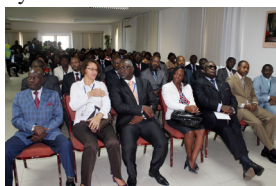
... devant les agents invités à la cérémonie....