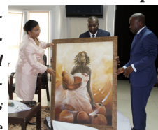
... a laissé découvrir le cadeau offert par le personnel.

ciales publiques, la conjugaison des efforts apparaît comme gage de réussite. D'où l'appel du Directeur Général lancé en des termes on ne peut plus clairs : « Unis, je reste convaincue par la synergie que peut entretenir notre groupe pour atteindre ces objectifs. Notre entreprise doit être un exemple de cohésion, de fraternité et de condescendance pour un idéal partagé. Donnons-leur le temps et les moyens d'apprécier le sentiment de bien-être qui peut s'échapper des moments de communion en entreprise autour des choses simples mais faites avec amour ». L'objectif de la bonne gouvernance recommande de récompenser le mérite et la productivité. C'est à cet effet, que la Direction Générale a enjoint la DRH « à accélérer le processus de mise en place d'outils de gestion homogènes, permettant une évaluation objective des performances de chacun et une juste rémunération du travail accompli ». C'est dans cette optique que les autres chantiers tels que la révision de la Convention Collective et la mise en place du règlement intérieur uniforme, ... devraient être finalisés avant la fin de cette année 2011.